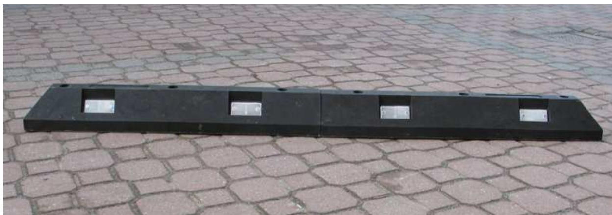
Ogranicznik – zdjęcia poglądowe